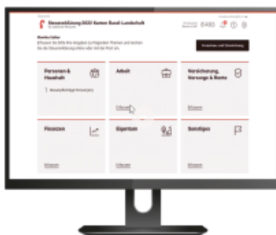
In der Eingabemaske von E-Tax BL können Sie die Erklärung nach Themen sortiert erfassen.

Die erforderlichen Belege, die mit der Steuererklärung einzureichen sind, werden elektronisch mitgeschickt. Mit Hilfe einer Scan-App auf dem Smartphone werden die Steuerbelege schnell und unkompliziert fotografiert, hochgeladen und mit der Steuererklärung verknüpft.